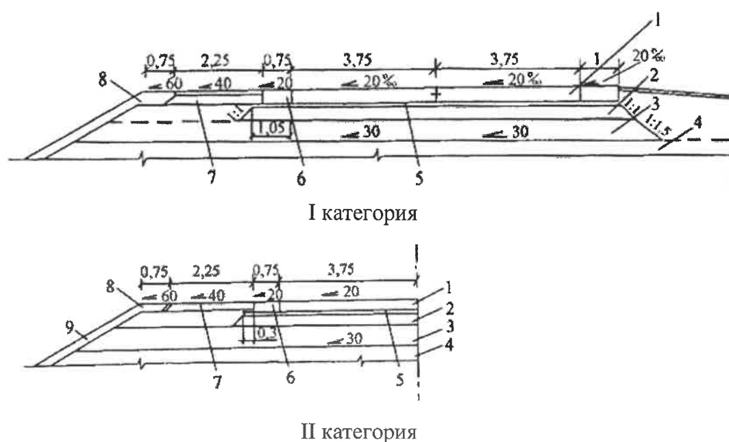
Рисунок Б.1 – Поперечные профили типовых дорожных одежд с цементобетонным покрытием для дорог I и II категорий:

Б.3 Поперечные профили типовых конструкций дорожных одежд фибробетонными слоями для автомобильных дорог I-IV категорий представлены на рис. Б.1 и Б.2 [3]. Варианты конструкций дорожных одежд с покрытием из фибробетона приведены на рис. Б.3 [3].