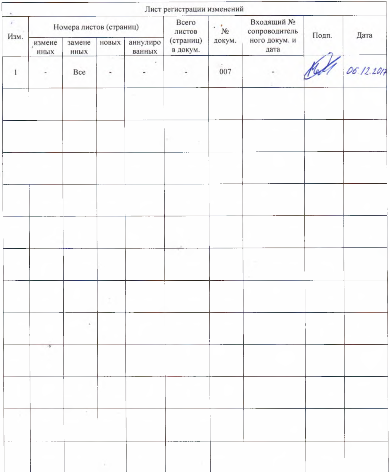
Таблица А.1 – Регистрация изменений