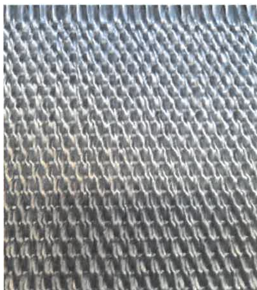
Рисунок 1 – Общий вид геоткани ПОЛИМЕРДОР по технологии ткачества

5.1.5 Общий вид геоткани ПОЛИМЕРДОР по технологии ткачества приведен на рисунке 1, по основовязальной технологии на рисунке 2, геометрические параметры – в таблице 1.