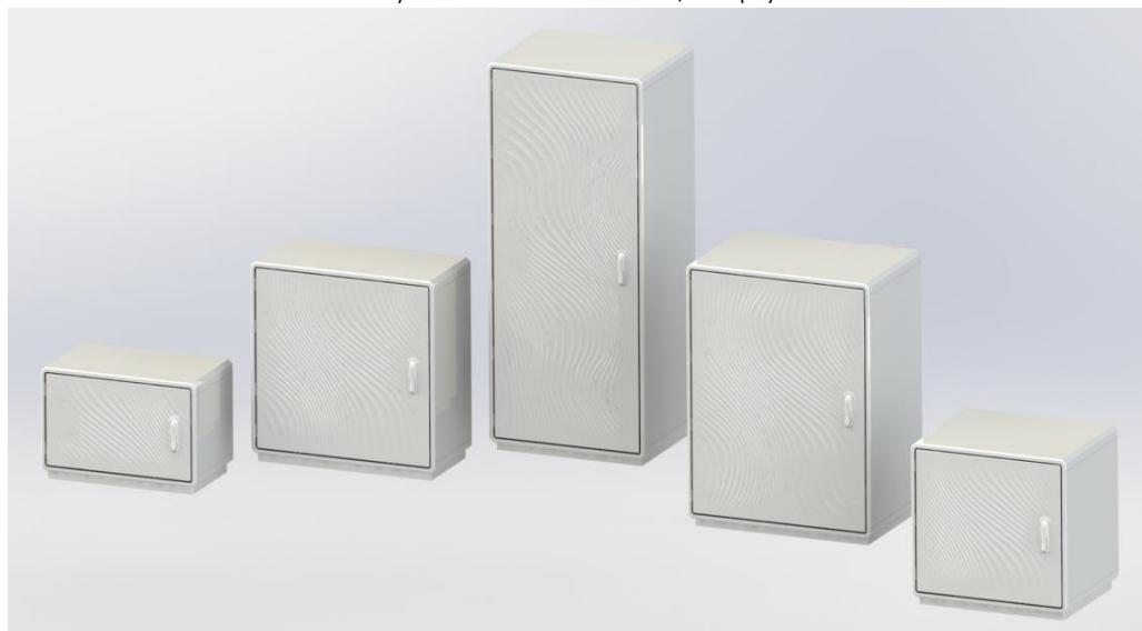
Рисунок А.2 – Исполнение корпусов